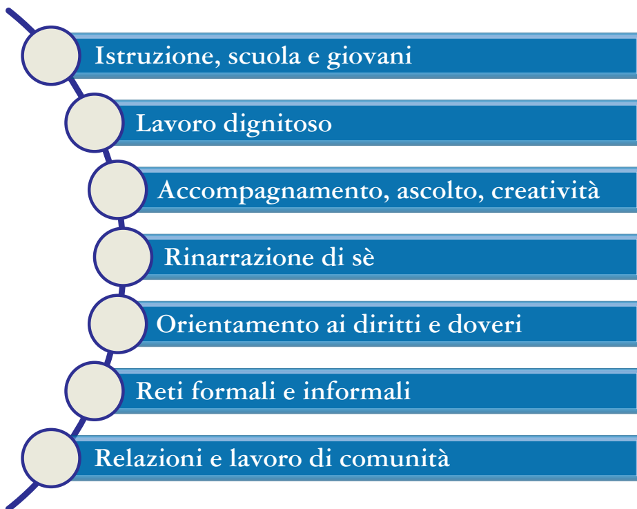
Fig.3 Macroaree di intervento e di approccio per spezzare la catena della povertà intergenerazionale

Ne sono derivate delle macro-aree di intervento e talvolta di approccio alle persone in povertà dalla loro nascita.