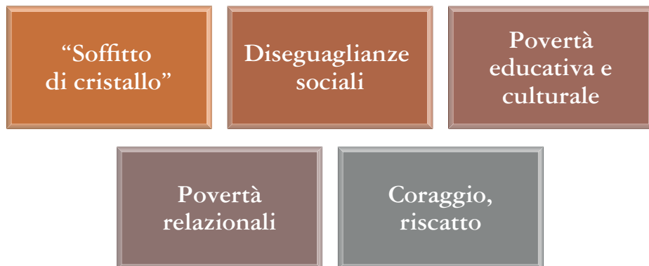
Figura 2. Le aree tematiche della percezione della povertà intergenerazionale.

Nella drammaticità del quadro, appare subito uno squarcio di speranza e di desiderio di operatività, dovuto forse anche al fatto che il tema è stato più presente nel dibattito nazionale e probabilmente ha favorito riflessioni tese a trovare soluzioni possibili.